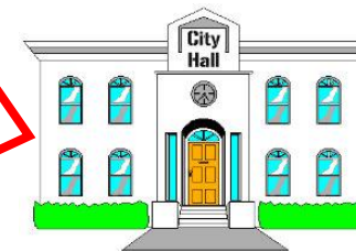
Органы местного самоуправления