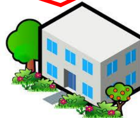
НПО, Союзы Ассоциаций, поставщики услуг