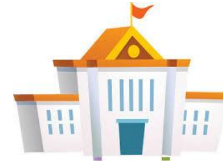
Министерство регионального развития и строительства