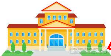
Технический Университет Молдовы Университетский центр непрерывного образования