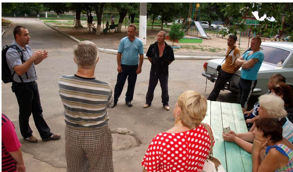
Вознесенск, 18.06.2016.