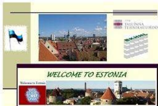
Слайд-презентации и pdf Представление ассоциаций из ЕС и СНГ