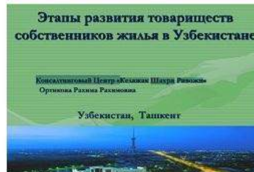
Новости и публикации О союзах и ассоциациях из ЕС и СНГ